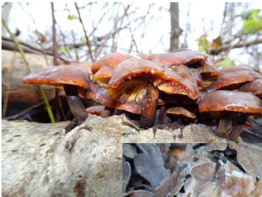
Deze paddenstoelen lopen op fluwelen pootjes