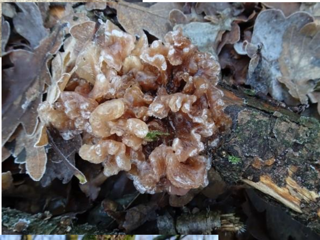
Dit is de Bruine trilzwam