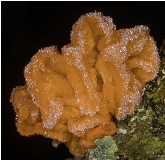
Bevroren gele trilzwam