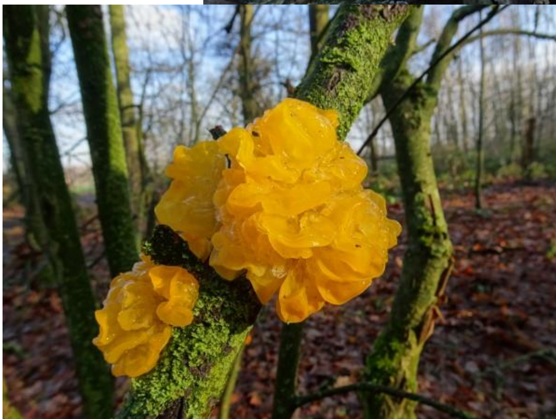
En dit de gele